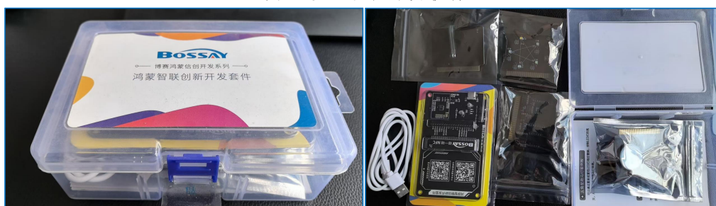
图 7 校企联合开发实验套件

打造了网络安全与法治保障方向，获批省级数据开发应用创新实验室（政法与司法），成为国家安全试验区（济南高新区）融合发展联盟、全国数字安全行业产教融合共同体理事单位（图 8）。