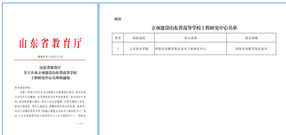
图4 获山东省高等学校工程研究中心