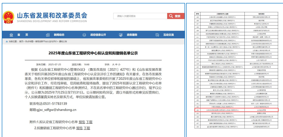
图5 获山东省工程研究中心