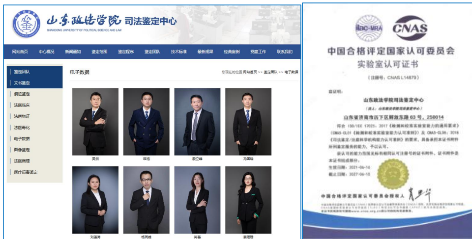
图3 电子数据鉴定实验室通过CNAS认证