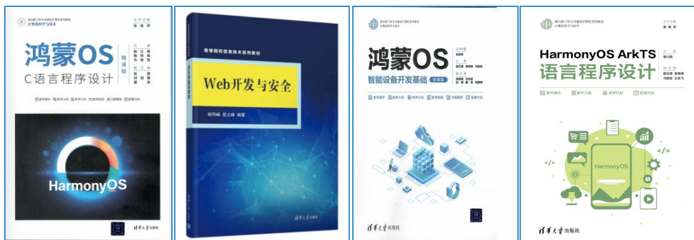
图 6 校企联合开发教材

打造了信创特色方向，校企联合出版《鸿蒙 OS 智能设备开发》等信创体系化教材 4 部（图 6），研发鸿蒙 OS 实验箱 1 套（图 7）；获批信创横向课题 2 项、信创实验室建设获批市校融合项目；当选信创市域产教联合体副理事长单位。