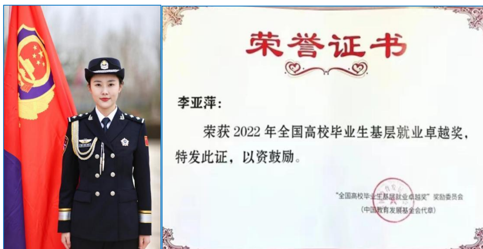
图 6 学生获“全国高校毕业生基层就业卓越奖”