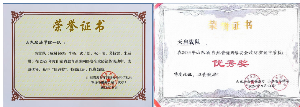
图 4 学生参加教育系统等攻防演练活动

学生服务社会（产业）意识和能力不断提高。学生参加上合峰会“护网行动”、省教育系统网安攻防演练等活动 7 次（图 4）；参加服务行业社会实践活动，获“三下乡”优秀团队 2 个。