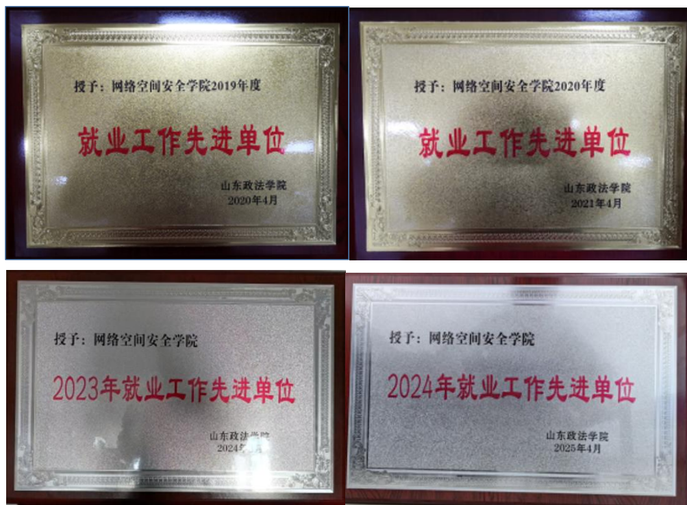
图 5 学院获评“就业先进单位”

人才与岗位契合度明显提升。5 年来，对口就业率达 98.4%，其中，融法类岗位占比 44.1%，提升 48.7%；学院 6 次被评为“就业先进单位”（图 5），毕业生李亚萍扎根公安特警一线，获“全国高校毕业生基层就业卓越奖”（图 6）。