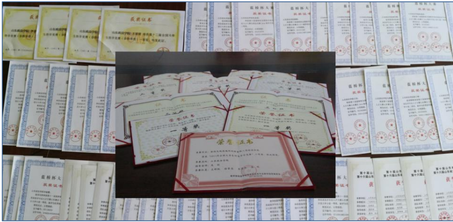
图 1 学生获奖证书

学生应用创新能力显著增强。学生 100%参加学科竞赛、创新创业大赛，获国家、省级奖励 400 余项（图 1）、完成作品 100 余项（图 2）；苏冠宇同学评选为华为 HSD 校园大使（图 3）。